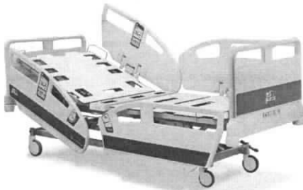
(Zdjęcie poglądowe oferowanego łóżka)